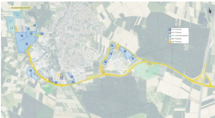
Parkplatzplanung im Rahmen des Masterplan Verkehr

Damit kann bereits heute sichergestellt werden, dass der Zufahrtsverkehr nicht mehr über Feldwege geleitet und Fernbusse nicht mehr durch den Ort geführt werden müssen. Der Komfort für den Rad- und Fußverkehr wurde deutlich verbessert.