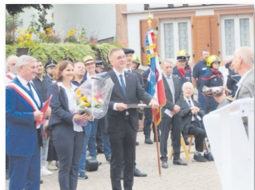
Impressionen vom Marlenheimer Bürgerfest anlässlich des Jubiläums