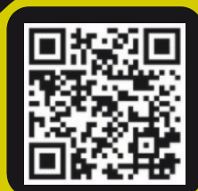
Unsere Juze Homepage

Wir bitten um Voranmeldung per Email für alle grün unterlegten Angebote bis 10 Uhr des Angebotstages