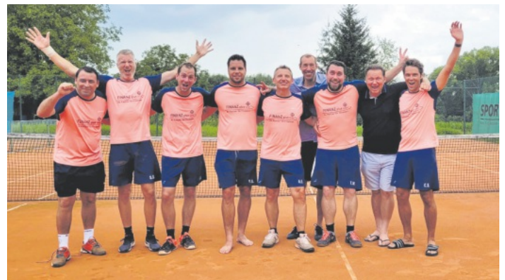
Die Mannschaft der Herren 30

Ab dem 31. August beginnt die Mixed-Runde und wir wünschen allen Mannschaften viel Erfolg!